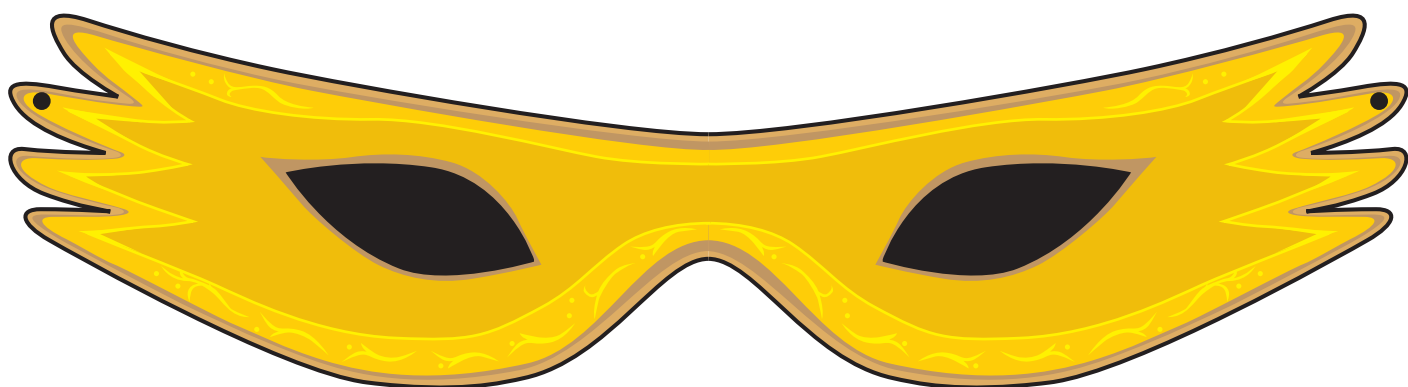
舞踏会風アイマスク